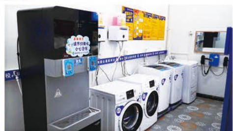
学生公寓生活设施