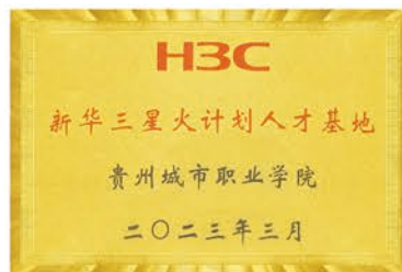
新华三与学校签约星火计划人才基地

产教融合是职业教育的重要支撑，学校持续深化产教融合、校企合作，进一步加强“校中厂、厂中校”建设，校企共建共享实训基地，与多家稳定合作的大中型企业开展岗位实习，经考核合格后由相关单位录用，实现毕业生“零距离”就业。