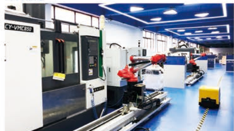
机电学院智能制造实训中心