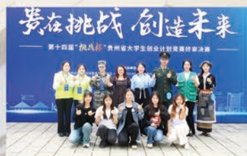
第十四届“挑战杯”中国大学生创业计划竞赛(国赛铜奖2项)