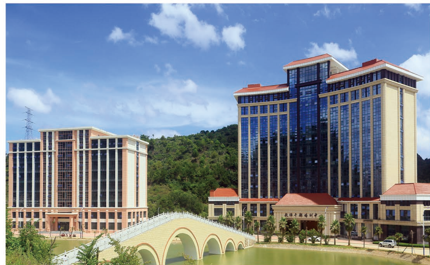
学校鸿源湖、教师干部培训中心