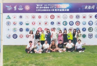
第九届中国国际“互联网+”大学生创新创业大赛贵州省赛决赛(金奖)