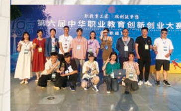
第六届中华职业教育创新创业大赛全国现场总决赛(高职组)(国赛二等奖)

学校鼓励教师、学生积极参加创新创业大赛和职业技能大赛，做到以赛促学、以赛促训、以赛促评、以赛促建，营造以赛促学提技能，比学赶超齐翼飞的良好态势。