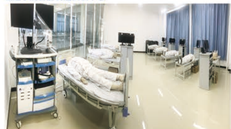
急危重症护理实训室