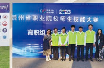
贵州省职业院校技能大赛暨全国职业院校技能大赛贵州省选拔赛创新创业赛项(一等奖)