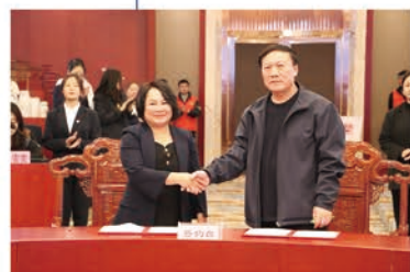
学校与企业合作签约