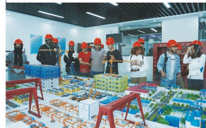
我校留学生参观学校实训室

学校于2019年1月获批外国留学生招收培养资格，迄今为止已先后招收来自刚果（金）、阿富汗、巴基斯坦、尼日尔等“一带一路”共建国家的留学生，积极参与教育国际交流事业，培养知华友华的国际友好使者。同时，为拓宽中国学生境外学历提升渠道，学校先后与韩国、泰国、马来西亚、波兰等国家的高等本科院校开展校际交流合作。合作内容包括境外合作院校交流生、学历提升等，学生可根据个人情况毕业后申请国外大学本科或本硕连读等校校合作项目，继续提升学历，开阔视野。