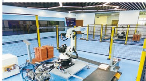
城建学院智能制造实训中心

先进齐全的实训设备，虚拟仿真的实训环境，丰富多样的实训项目，完善创新的实训氛围，专业资深的实训导师。