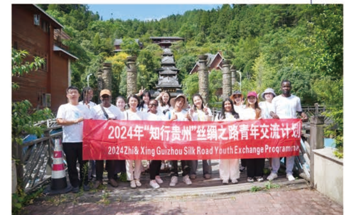
我校留学生参加“知行贵州”丝绸之路青年交流计划