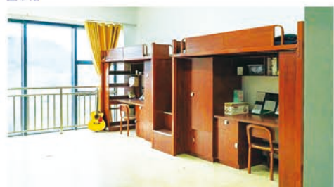
学生公寓四人间内景