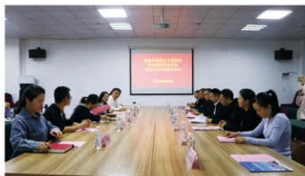
贵阳市花溪区人民医院与学校“校企合作”挂牌签约