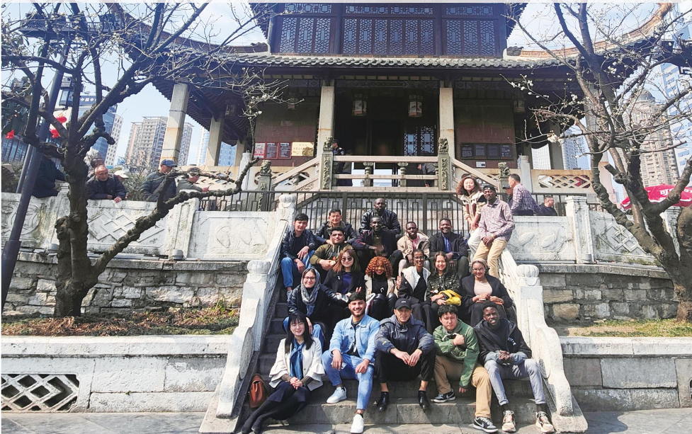
我校留学生甲秀楼合影

学生在校期间可通过专升本读完成本科学业，衔接的本科院校有贵州医科大学和贵州财经大学。