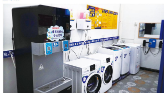
学生公寓生活设施