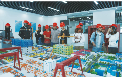
我校留学生参观学校实训室

学校于2019年1月获批外国留学生招收培养资格，迄今为止已先后招收来自刚果（金）、阿富汗、巴基斯坦、尼日尔等“一带一路”共建国家的留学生，积极参与教育国际交流事业，培养知华友华的国际友好使者。同时，为拓宽中国学生境外学历提升渠道，学校先后与英国、新西兰、韩国、泰国、马来西亚、俄罗斯等国家的高等本科院校开展校际交流合作。合作内容包括境外合作院校交流生、学历提升等，学生可根据个人情况毕业后申请国外大学本科或本硕连读等校合作项目，继续提升学历，开阔视野。