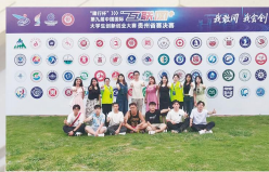
第九届中国国际“互联网+”大学生创新创业大赛贵州省赛决赛 (金奖)