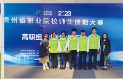
2023年贵州省职业院校技能大赛暨全国职业院校技能大赛贵州省选拔赛创新创业赛项 (一等奖)