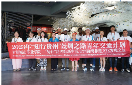
2023年“知行贵州”丝绸之路青年交流计划