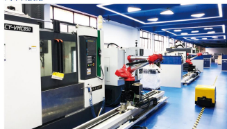
智能制造实训中心