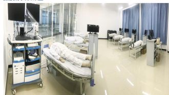
急危重症护理实训室