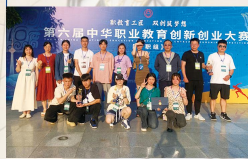
第六届中华职业教育创新创业大赛全国现场总决赛(高职组) (国赛二等奖)