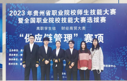
2023年贵州省职业院校技能大赛暨全国职业院校技能大赛贵州省选拔赛供应链管理赛项 (一等奖)