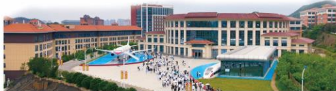
▲ 学校图书馆、民航高铁专业实训基地