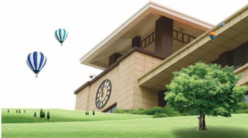
▲ 教学科研行政楼角