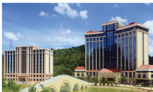
▲ 学校鸿源湖、教师干部培训中心