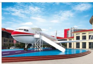
▲ 学校航空商务实训中心

因为一所大学 我爱上一座城市 源于一个梦想 我选择一门专业 牵手城院 有业有诗有远方