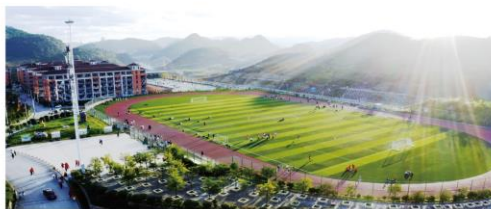
▲ 学校足球场、田径场、篮球场、学生宿舍

学校内设有贵州省农村信用社取款机,来校途中请注意人身财产安全,遇事不惊慌,冷静处理,必要时就近求助或及时拨打报警电话。