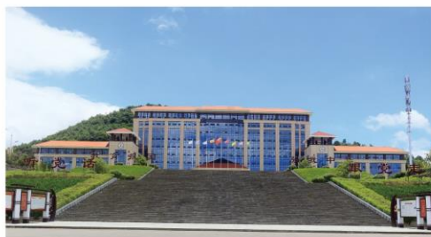
▲ 学校教学科研行政楼